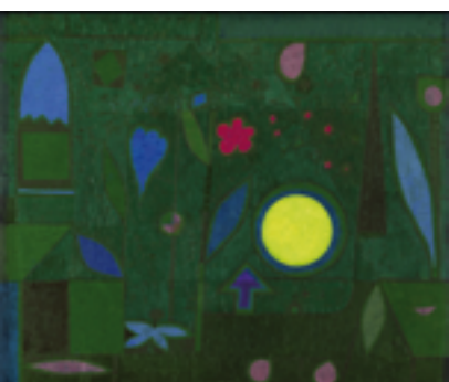
Paul Klee, Vollmond im Garten, 1934