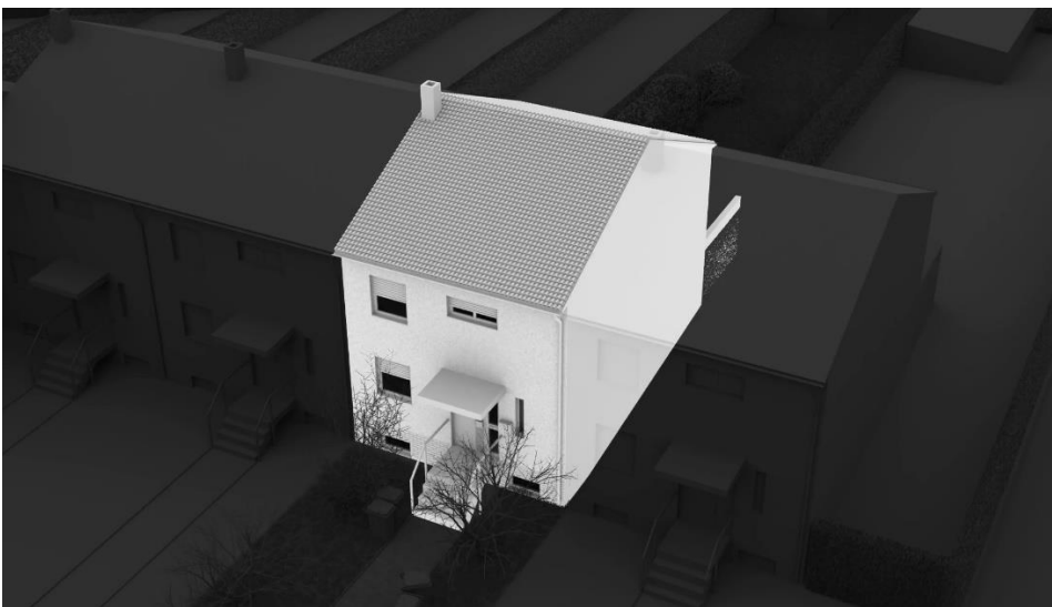
Rassistischer Terroranschlag in Hanau • Das Haus des Täters • digitale Grafik digital graphic, 2022 • © Forensic Architecture + Forensis